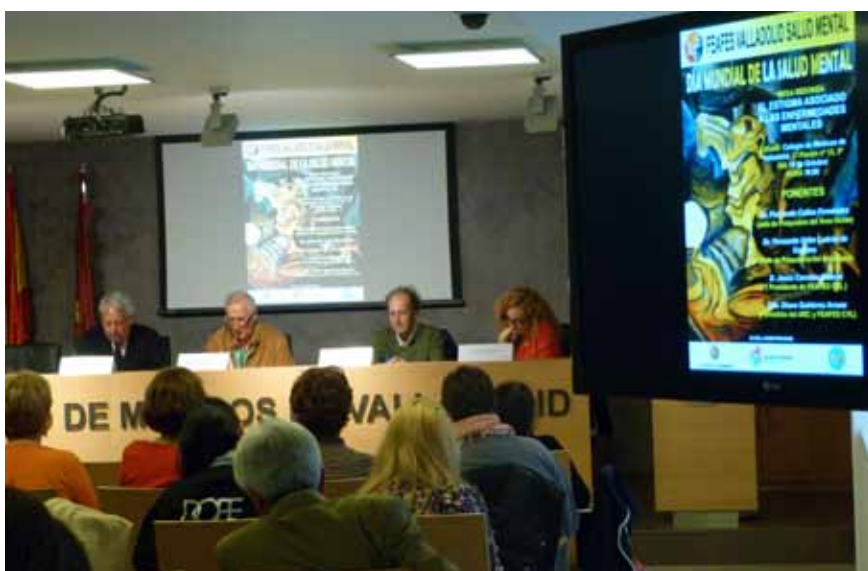
La jornada tuvo una gran acogida de público