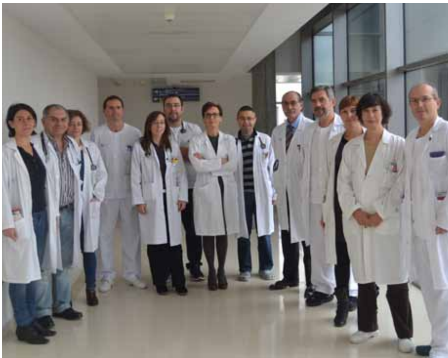
Algunos de los médicos que forman el equipo de este servicio