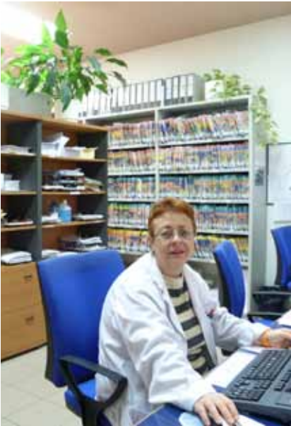
La recepción del centro