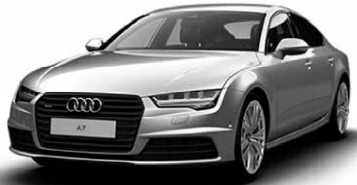
Nuevo A7 Sportback

Venga y descubra todas las ventajas que podemos ofrecerle.