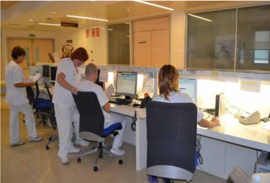
Control de Enfermería del Servicio de Cardiología del HURH

de Urgencias, pendientes de nueva valoración y/o realización de alguna prueba complementaria. A continuación, y dependiendo de los días, se presentan casos clínicos según criterio de cada cardiólogo para su discusión y toma de decisiones, o se desarrollan sesiones de revisión de algún tema, presentadas por residentes y supervisadas por adjuntos.