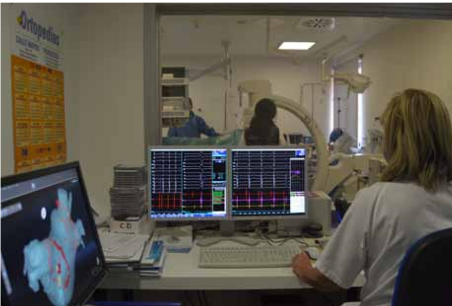
Sala de electrofisiología

Por otro lado como ya se ha mencionado, en colaboración con el Servicio de Radiodiagnóstico, desde el año 2009, un cardiólogo realiza TAC coronarios (entre cuatro y cinco estudios semanales) y desde finales del año 2012 también se realizan Resonancia Magnéticas cardíacas.