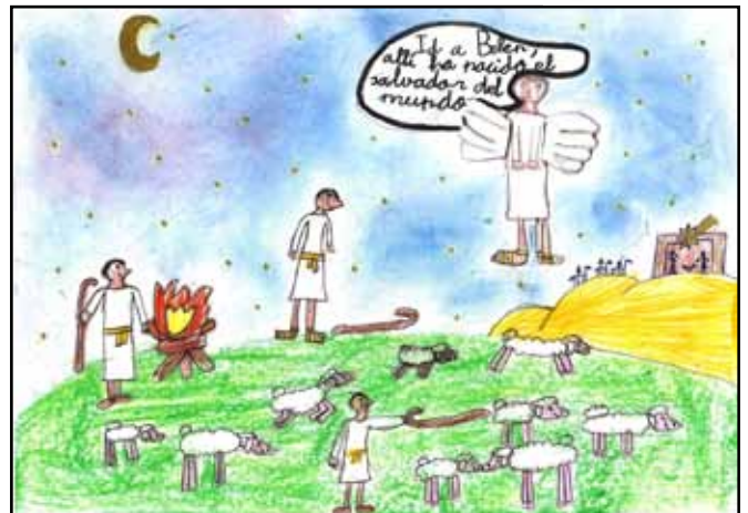
“UNA BUENA NOTICIA”. Autora: Alicia Albillos Sanz, de 7 años.