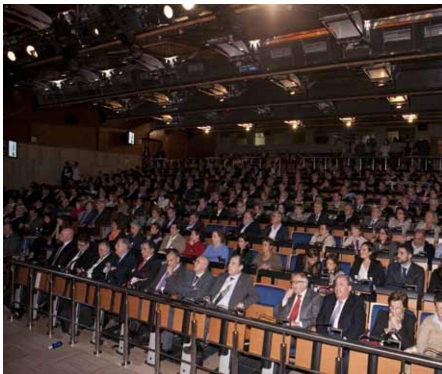
El acto contó con una gran participación

6. A pesar de la situación de crisis y los indiscriminados recortes producidos en el