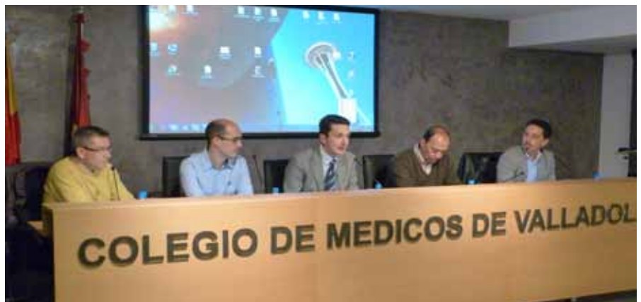
La mesa al completo con los ponentes de la jornada del día 13

La Diabetes afecta a 382 millones de personas en todo el mundo, y la de tipo 2 al 13,8% de la población mayor de 18 años en España. Muchos de los esfuerzos que se realizan para combatir esta enfermedad están centrados en concienciar a la sociedad de que la diabetes de tipo 2 (mucho más frecuente que la de tipo 1) es prevenible. 30 minutos de ejercicio diario y una dieta saludable pueden reducir drásticamente el riesgo que