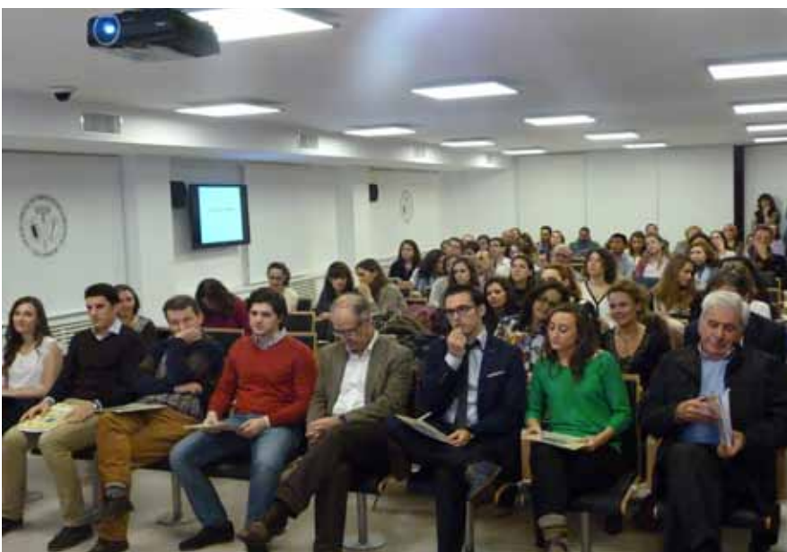
Los premiados, en primera fila, con todos sus compañeros y amigos entre el público