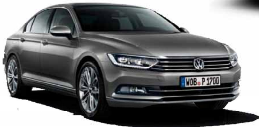
Nuevo Volkswagen Passat

Valladolid Wagen Av. Burgos 54 Tel. 983 36 09 90 47009 Valladolid www.valladolidwagen.es