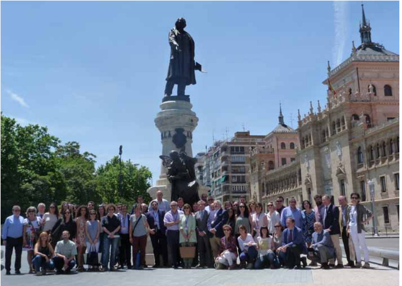
Foto de familia con todos los RESCOM asistentes al Congreso

su apoyo y reconocimiento a la labor de los responsables de comunicación de los Colegios de Médicos, como intermediarios entre el Colegio y los medios y apeló al periodismo como una forma de contar historias que llegan a las personas y resaltó el compromiso que requiere esta profesión para contarlas cuando “nos dedicamos a temas de salud”.