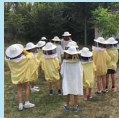
En la fiesta infantil celebrada estos días, los más pequeños disfrutaron de actividades al aire libre en La 'Huerta de Valoria' ubicada en Valoria del Alcor

Desde el Colegio de Médicos de Valladolid queremos agradecer el patrocinio de A.M.A, La Flecha Motor BMW Service, Sanitas, Mutual Médica, Justo Muñoz, Makro, Olé con Olé, Loculto, Primitivos, Hotel Puerta de Sahagún, Ruta del Vino Cigales y Caballos de Simancas; todas empresas colaboradoras con nuestra entidad sin las cuales este Día dedicado a la profesión no sería posible.