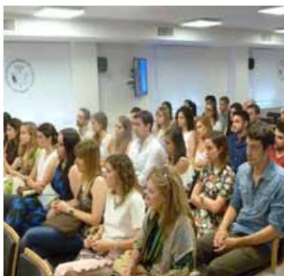
Los nuevos residentes durante el acto