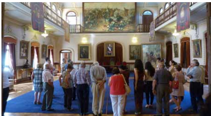
Uno de los momentos de las visitas guiadas por la Academia de Caballería