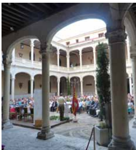
Este día se celebró en el patio del Palacio Real