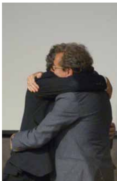
Expresidente y Presidente se abrazan durante el homenaje que se celebró en el Colegio