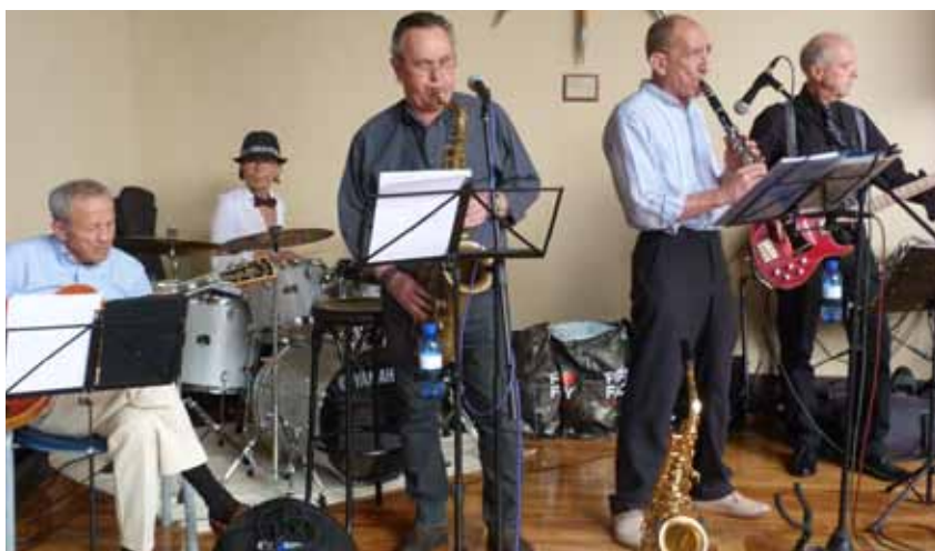
El quinteto 'Dacapo' amenizó el cóctel