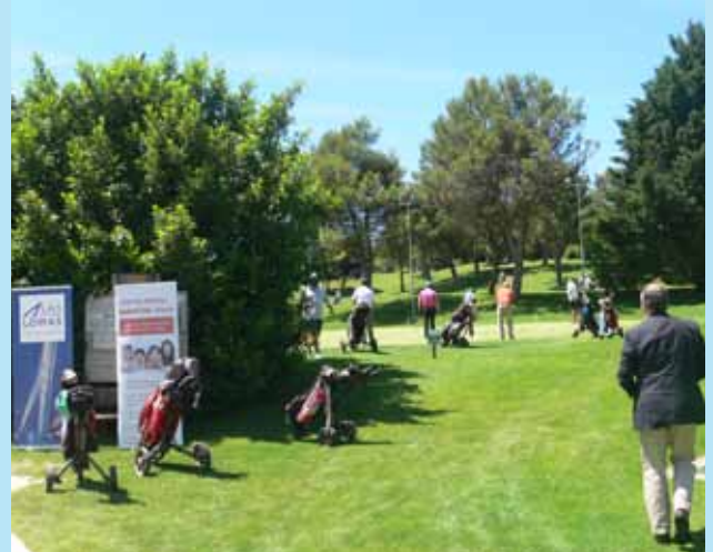
El Campeonato de Golf se organizó, un año más, en el Club de Campo de Galera