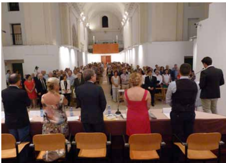
Los asistentes se pusieron de pie para escuchar la lectura de la Declaración de Ginebra