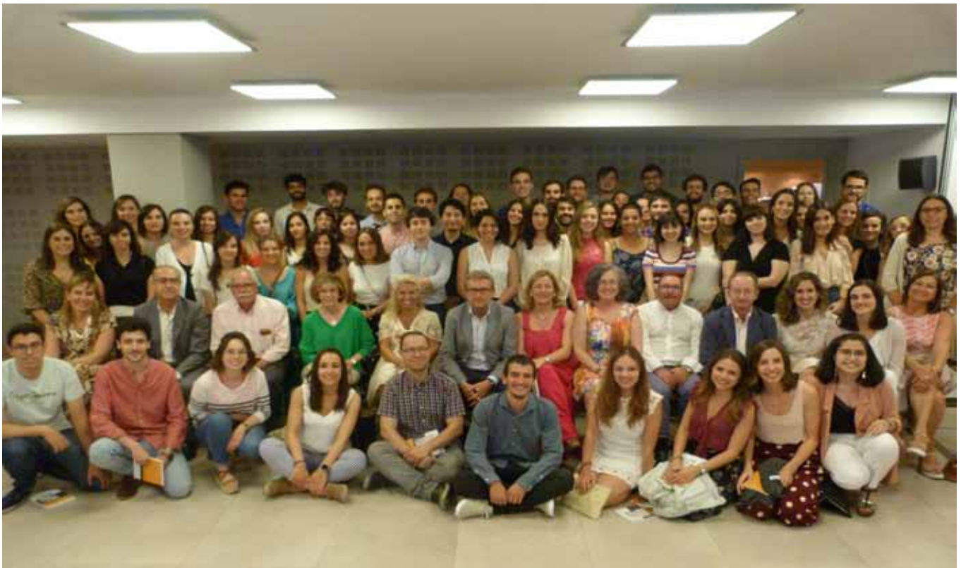
Foto de familia de los nuevos residentes con los miembros de la Junta Directiva del Colegio de Médicos

A su vez, no dejaron pasar la oportunidad para insistir en que el Colegio de Médicos será siempre un lugar al que podrán acudir cuando necesiten ayuda, consejo o apoyo, porque esta entidad siempre buscará lo mejor para todos sus profesionales.