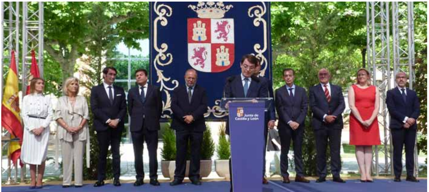
Fernández Mañueco durante su discurso en la toma de posesión de sus nuevos consejeros

que ha ejercido hasta el momento”, por lo que no dudó en asegurar que desde la institución colegial que él preside “confiamos y estamos convencidos de que abordará toda la problemática de nuestro sistema sanitario regional y emprenderá acciones eficaces para nuestros ciudadanos, pero también para los médicos”.