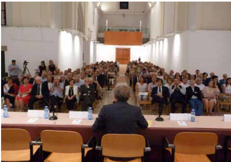
A este Día del Médico acudieron más de 300 personas

A continuación se hizo entrega de los títulos a los colegiados honoríficos que cumplían 70 años en el periodo comprendido entre el 27 de junio de 2018 y el 28 de junio de 2019, y a los