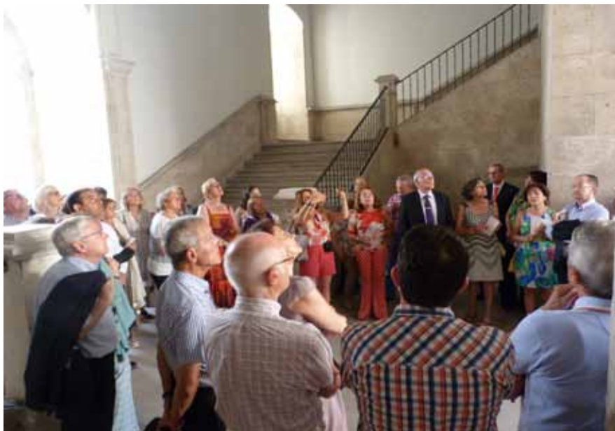
Antes de dar comienzo al acto, se realizaron una serie de visitas por el Monasterio

Los actos institucionales comenzaron por la mañana con una misa en honor a los colegiados fallecidos durante el año, que tuvo lugar en la Iglesia Parroquial de Nuestra Señora de San Lorenzo, y con la que se quiso recordar a los compañeros que ya no están con nosotros.