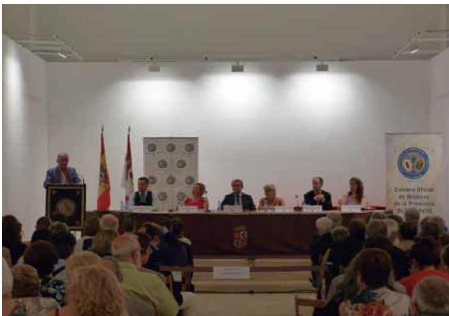
La Permanente de la Junta Directiva presidió esta jornada de celebraciones