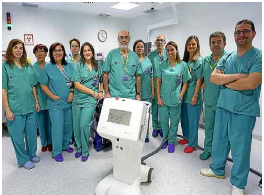
Equipo del Servicio de Radiología Radioterápica del hospital Clínico Universitario

Si el médico dedica un tiempo importante, total o parcial, a los CP tendrá la satisfacción de ejercer una especialidad humana como ninguna, apasionante, gratificante, con gran reconocimiento