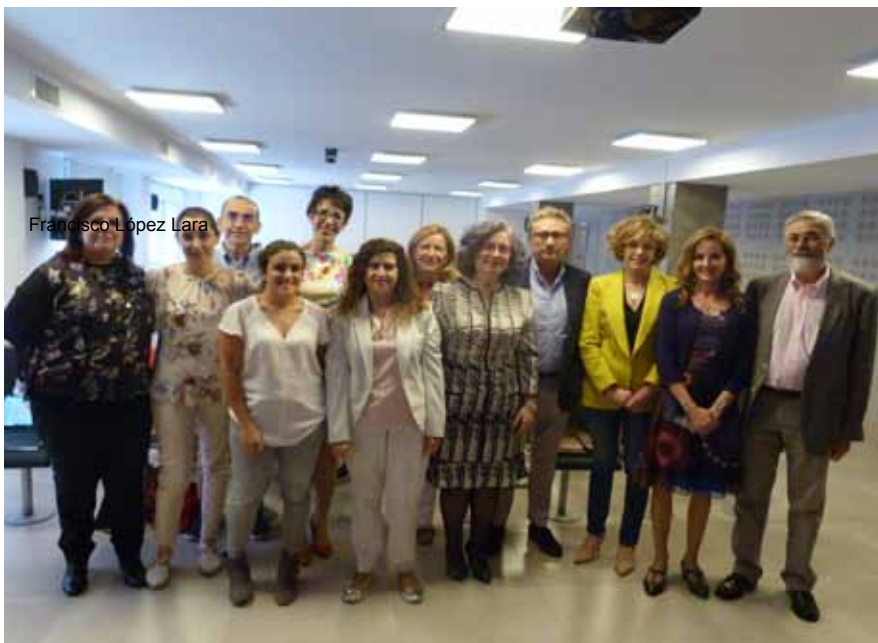
Los ponentes de esta jornada posan junto los miembros de Colegio de Médicos que presentaron el acto

En esta ocasión, el Colegio de Médicos de Valladolid acogió la reunión en su afán por favorecer la formación y la coordinación asistencial desde la propia institución y de sus colegiados.