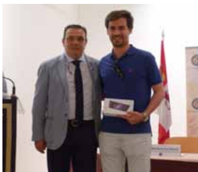
Los sorteos fueron patrocinados por A.M.A y Mutual Médica