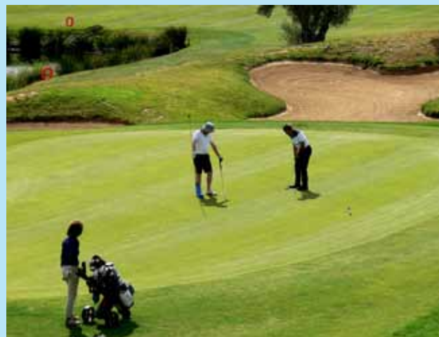
El Campeonato de Golf se disputó en el Club de Campo de Sotoverde